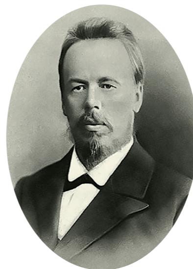
Александр Степанович Попов

В развитии диагностики туберкулёза огромное значение имело открытие X-лучей в 1895 году В. Рентгеном (1845–1923), после чего рентгенологические исследования стали и остаются до сих пор ведущим методом диагностики туберкулёза органов дыхания. К началу XX века следует отнести становление хирургического метода лечения туберкулёза лёгких.