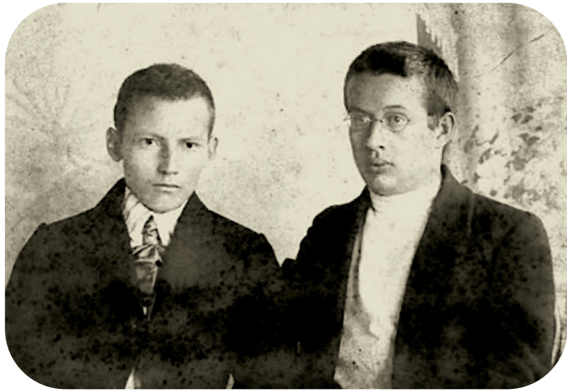
Габдулла Тукай и Фатих Амирхан. Казань. 1912