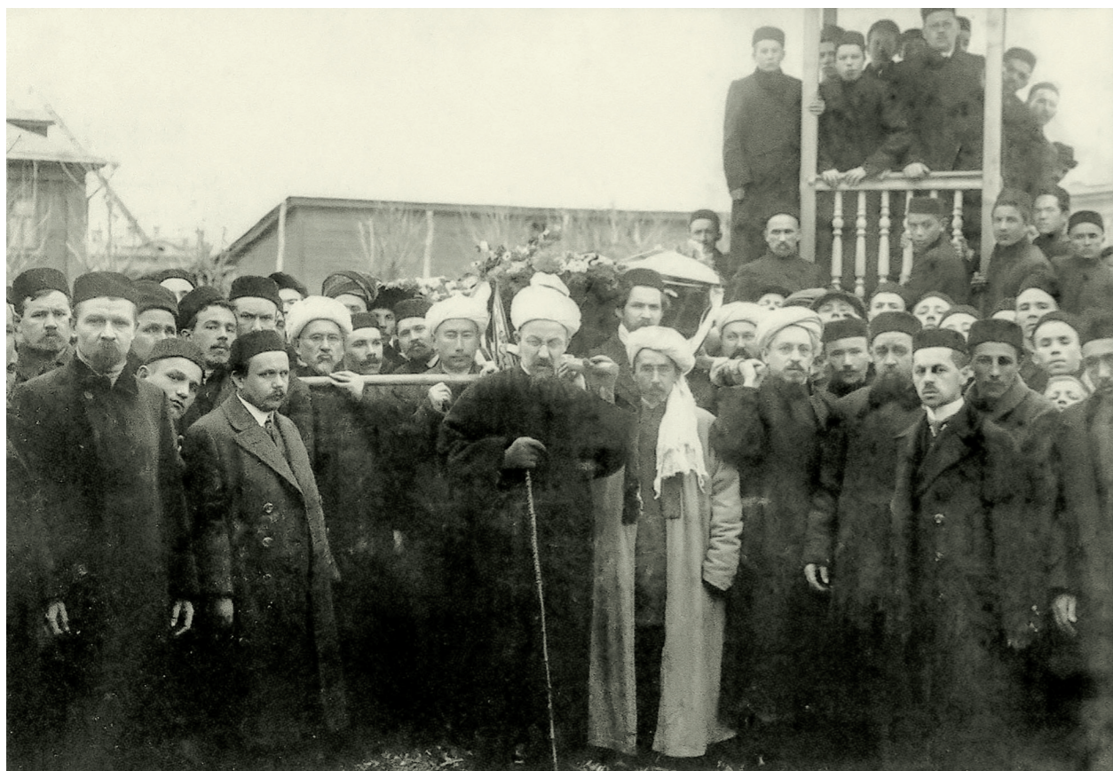
Похороны Габдуллы Тукая. Казань. 1913

(1881) отметил оздоровительную роль кумыса не только при лечении туберкулёза, но и других заболеваний. В 1890 году он выпустил в свет второе издание этой книги, где предлагал назначать больным в качестве курса лечения не менее восьми-двадцати бутылок кумыса.