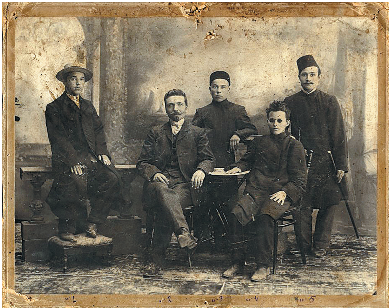
Габдулла Тукай среди уральских товарищей. Уральск. 1906