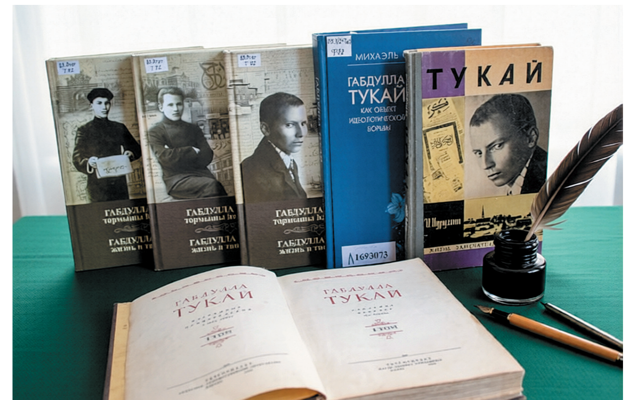
Книги о Габдулле Тукае, вышедшие в разное время.

Как это часто бывает, трагическая смерть выдающегося человека превозносит его, делает недостижимым для других. Это произошло и с Тукаем. Мучительная смерть от тяжёлой формы туберкулёза вознесла его выше всей татарской интеллигенции, он мгновенно был признан светочем национальной культуры и интел-